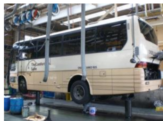
指定整備工場による3カ月点検