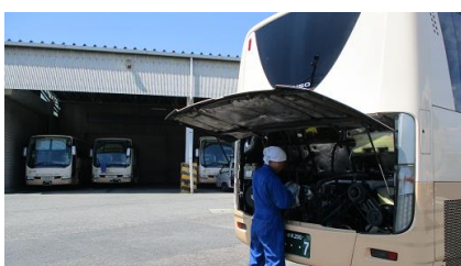
運転士による日常整備